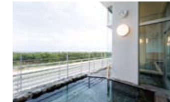
心地よさを感じる和風露天風呂

家族・福祉風呂 (スライドリフター付) 車いす利用者の方にも安心してご利用いただけるスライドリフターをご用意。座ったままの姿勢で入浴でき、また、ご家族も一緒に安心してご利用できます。休憩室も6畳の和室スペースをご用意していますので、お着替えの際も余裕もって対応できます。