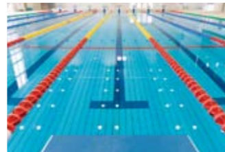
2mのコース幅でゆったり気持ちよく泳げます。透視度は抜群!!