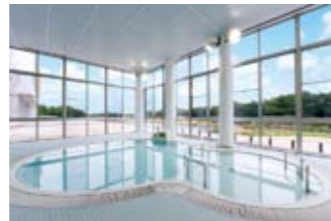
幼児専用プールで家族みんなと楽しく水遊びが可能。浮き具の無料レンタルもあります。