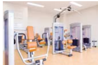
基礎代謝のアップに役立つ 8 種類のマシンと有酸素運動ができる 3 種類のマシンを取り揃え利用目的に合った運動が行えます。