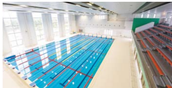
市内最大級の25m×8コースの温水プールで自然の光を浴びながら、楽しく・のんびり・ゆったりと泳げます。

(財)日本水泳連盟公認の25m室内温水プールです。一年を通して水温 30 度に保っており、快適でクリーンな温水プールでスイミングが楽しめます。床が可動式になっており、3 コースと 5 コースに分かれて水深を変えることができますので、使用目的に応じてご利用でき、年齢や程度に応じて様々なプログラムを準備して、専任のインストラクターが親切丁寧に指導します。隣には幼児用プールもあり、小さなお子様も安心して楽しみながら水に親しむ事ができ、万一の場合に備えて、医務室、採暖室等を準備。2 階には、262 名収容出来る観客席があり、色々なイベントも催す事ができます。