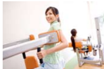
お腹・ウエストの引き締めにも効果的なロータリーローラー&ツイストで健康的なくびれを。