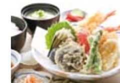
天ぷら定食 地採れの旬の食材を新鮮なまま天ぷらに

手打ちの製法にこだわった自家製の生うどんは、本格的でリーズナブル。厳選した小麦粉をじっくり熟成させた麺は、もちもち、ツルツルが特長です。また、こだわりのうどんと食べる天ぷらも美味しい。地元宮崎で採れる旬の食材を農家直送で仕入れて、新鮮なうちに調理し、食材もつ本来の美味しさ、みずみずしさを壊さずにご提供します。