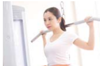
背中への引き締めにも効果的なラットプルダウンで美しい背中を。

最新式の機種を揃えたトレーニングルーム。体組成計や血圧計からのデータを元にインストラクターがご利用者の体力維持や増進などの目的に合ったプログラムを用意、効果的なマシンの使用方法を指導します。解放感一杯のスペースでいい汗を流してリフレッシュやストレス解消にもご利用ください。