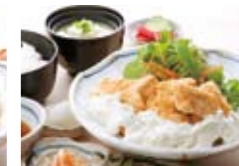
チキン南蛮定食 宮崎県産若鶏のもも肉を特製の甘酢とタルタルで