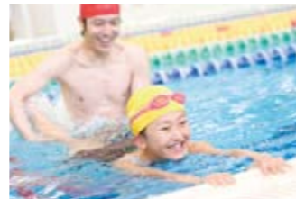
お子様のココロとカラダの健全な発達を促し、可能性を広げる事を旨とする、スクールを実施。