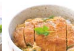
かつ丼 宮崎県産の旨味たっぷりの「天恵美豚」を使用