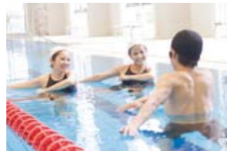
泳げない人でも安心!! 脂肪燃焼プログラムや水中歩行プログラムまで、水中ならではの効果と楽しさを体験できます。