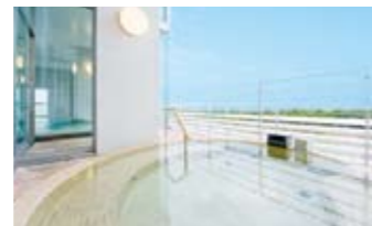
壮大な自然につつまれた洋風露天風呂